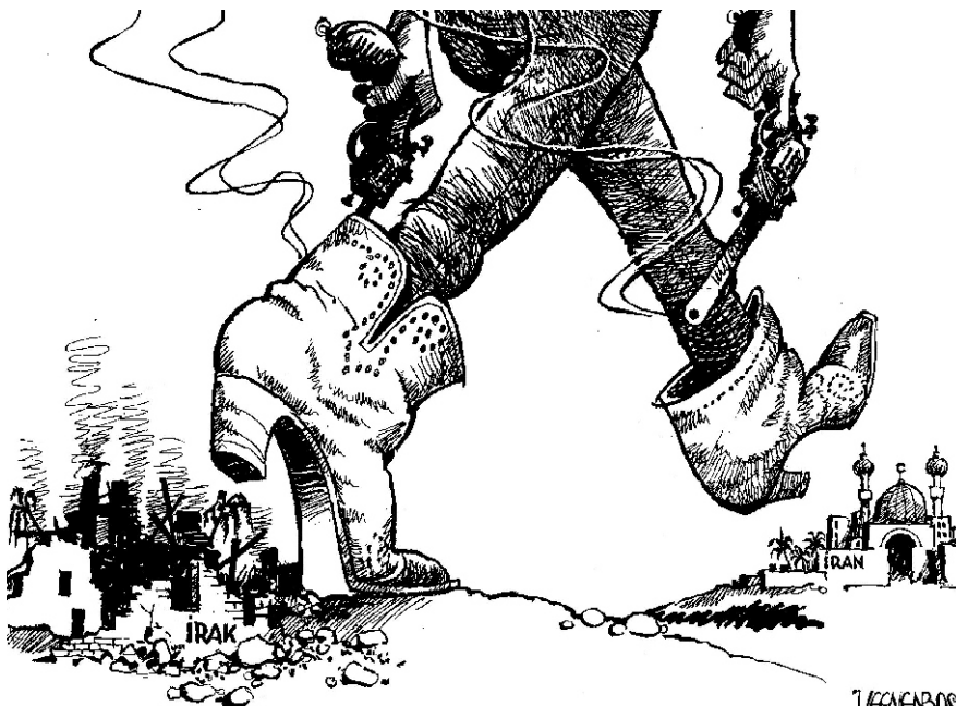
Karikatur: Der Standard

Aus dieser globalen Sicht nehmen wir zu aktuellen politischen Konflikten Stellung. Dabei erweist sich ein aus der Epoche des Kalten Kriegs tradiertes Beurteilungssche-